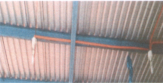
Foto 5: finalización de Reparación de sistema eléctrico en las aulas del establecimiento