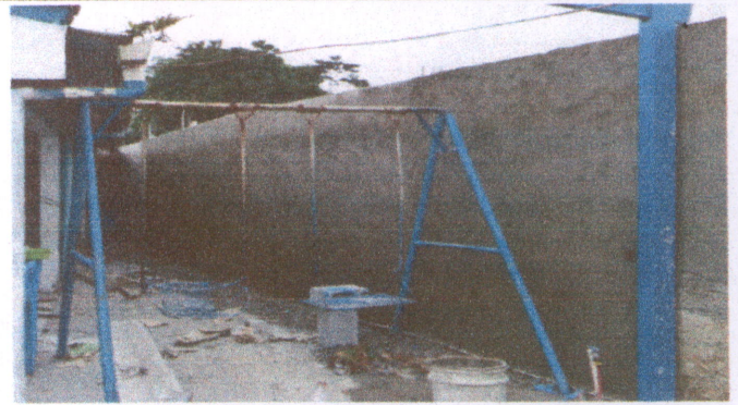
Foto 8: finalización de Repello en muro y alisado en muro perimetral.