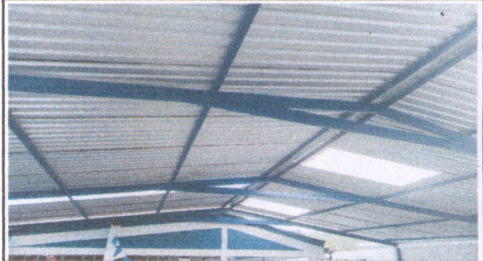
Foto 2: Finalización de sustitución de estructura de soporte de metal por metal en el patio del establecimiento.