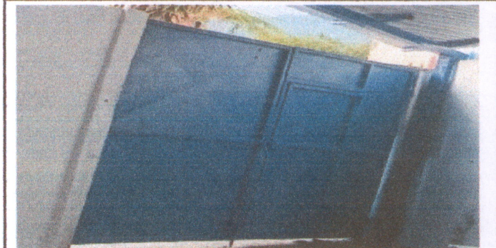
Foto 6: Finalización de la Fabricación e instalación de Portón de Metal de Ingreso al establecimiento.

Observación: Si es necesario se pueden agregar hojas adicionales y actualizar el número de hojas.