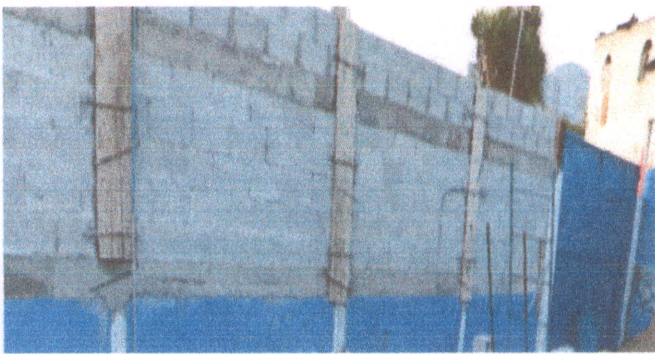
Foto 3: Reparación de muro perimetral de block en el establecimiento.