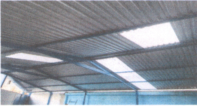
Foto 1: finalización de Sustitución de lámina, por lámina troquelada aluzinc calibre 26, en el patio del establecimiento.