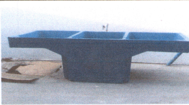
Foto 7: Finalización de instalación de sustitución de pila de cemento de dos lavaderos en la terminación del pasillo del establecimiento